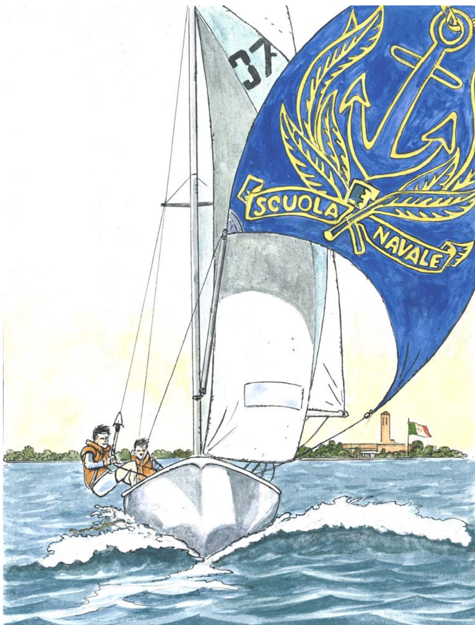
Illustrazione di Fuga e Vianello